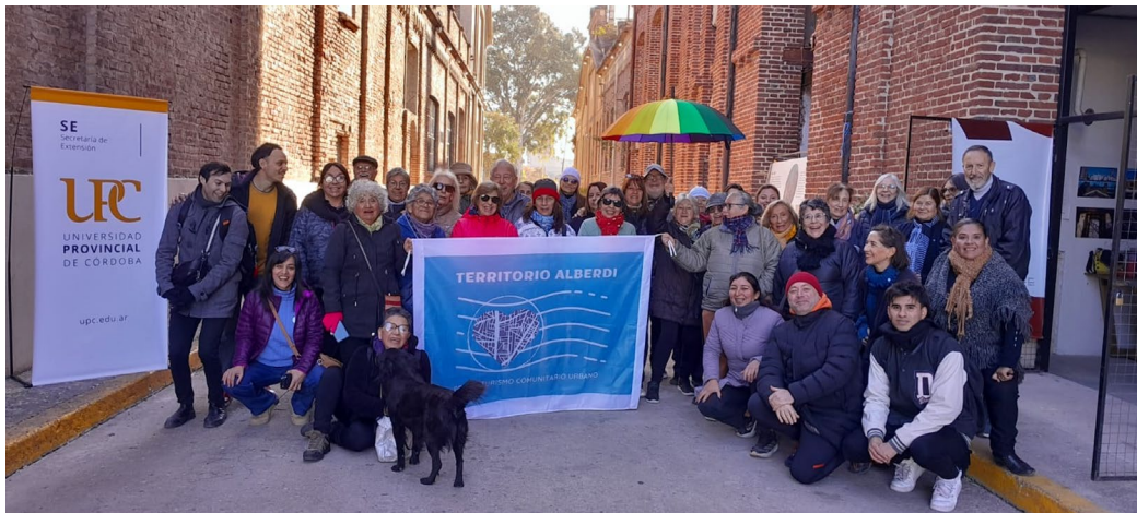
Figura 6. Recorrido organizado en conjunto con el Programa Bien Estar de adultos mayores UPC