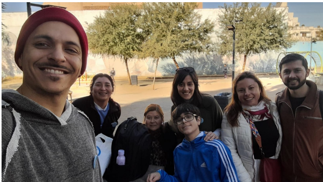
Figura 2. Equipo de trabajo en territorio

En conjunto, este artículo no solo describe la implementación de un proyecto de turismo comunitario en Barrio Pueblo Alberdi, sino que también reflexiona críticamente sobre los desafíos y posibilidades de cocrear experiencias turísticas en contextos urbanos con fuerte identidad barrial. Se propone una mirada integradora que subraya la importancia del diálogo y la colaboración entre actores sociales para construir prácticas turísticas sostenibles y socialmente responsables. Desde esta perspectiva, el trabajo busca aportar nuevas formas de comprender y practicar el turismo urbano, promoviendo modelos inclusivos que reconozcan la diversidad cultural y el valor del patrimonio local.