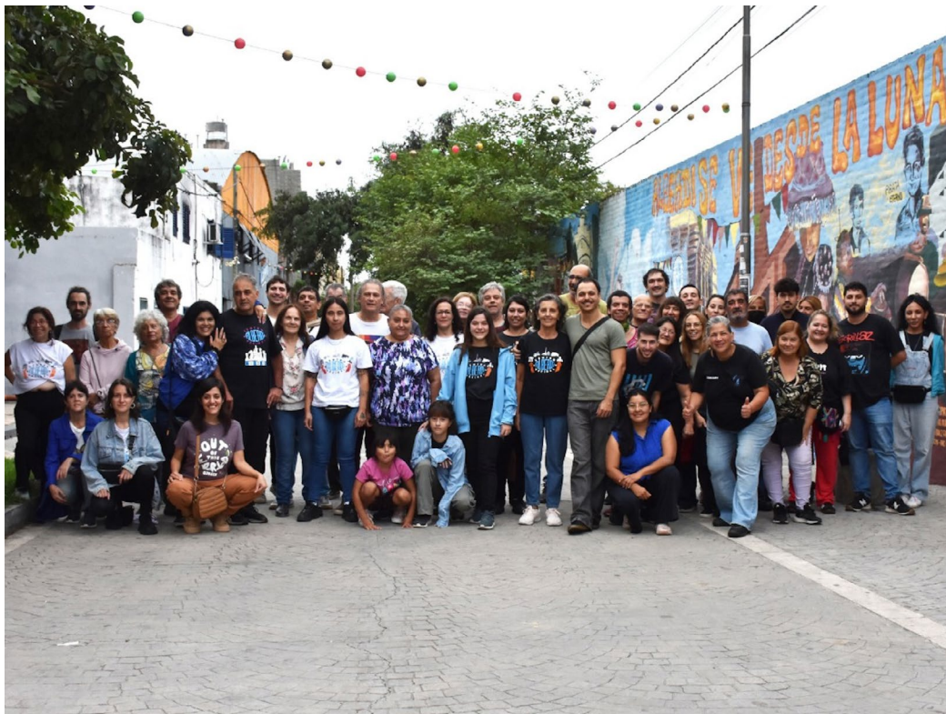
Figura 3. Comunidad de Barrio Pueblo Alberdi.