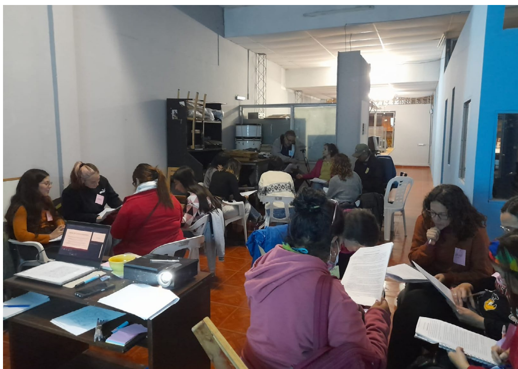
Figura 4. Talleres de participación comunitaria

Alberdi, en junio de 2023, se convocó a la comunidad a través de redes sociales y reuniones mensuales, con el objetivo de construir una red inclusiva que reflejara la diversidad del barrio. La participación fue abierta a todos, no solo a profesionales del turismo, lo que permitió una integración de distintos actores locales como guías, emprendedores y organizaciones comunitarias. El proceso incluyó debates y actividades grupales que ayudaron a definir el enfoque del turismo comunitario y a diseñar circuitos turísticos que respondieran a las necesidades e intereses de la comunidad. 8